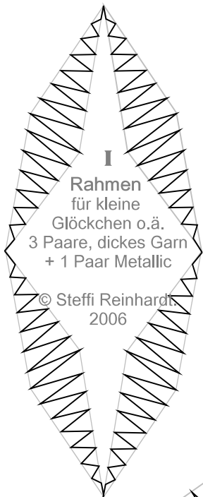
I Rahmen für kleine Glöckchen o.ä. 3 Paare, dickes Garn + 1 Paar Metallic