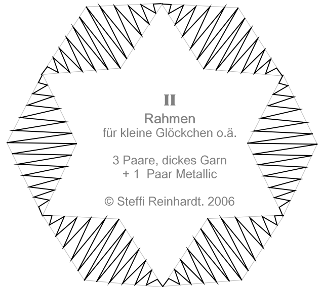
II Rahmen für kleine Glöckchen o.ä.

Viel Spaß beim Klöppeln. Steffi Reinhardt © 2006.