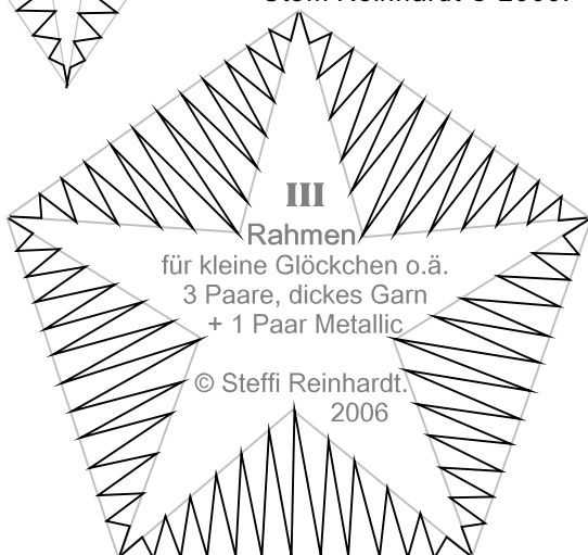
III Rahmen für kleine Glöckchen o.ä. 3 Paare, dickes Garn + 1 Paar Metallic